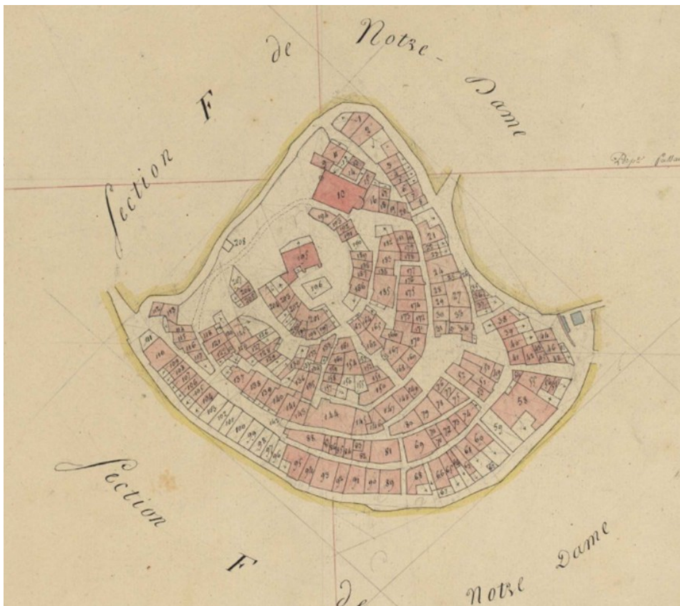
Le village d'Entrevennes en 1824, cadastre napoléonien.